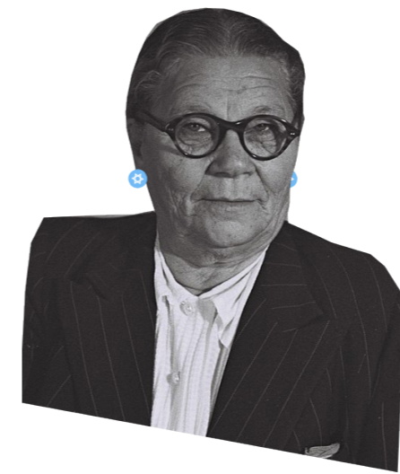
עדה מימון

מהמייסדות ומהמובילות של מפלגת הפועל הצעיר ותנועת הפועלות, חברת הכנסת הראשונה והשנייה מטעם מפא"י ומהיזמות של חוק שיווי זכויות האשה. פמיניסטית שנלחמה למען זכויות נשים, שומרת מצוות, שנודעה בחריפות לשונה ובאישיותה החזקה וסירבה לקבל שכר עבור כהונתה בכנסת. נחשבת לאחת המתעדות המרכזיות של תולדות תנועת הפועלות בארץ ושל התנועה לשחרור האישה בישראל. בשנים שקדמו להקמת המדינה.