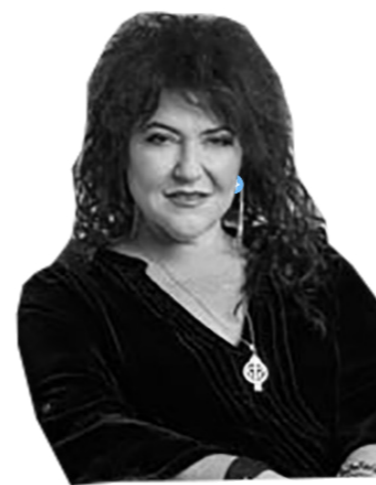
צילום: יונתן בלום

כשהייתה בת 20 בלבד תיעלה את תקופת נעוריה הקשה לעשייה חברתית ענפה, ובמרכז פתיחת "בית השנטי", מוסד מוכר וחשוב בארץ המשמש כבית לנוער בסכנה, נוער שנפלט מביתו בגלל התעללות מילולית, פיזית או נפשית וכזה שאף מסגרת אחרת לא הצליחה לעזור לו. עד היום הוא הצליח לעזור ללמעלה מ-30 אלף בני נוער בין הגילאים 14-21 שמקבלים ממריומה מסר זהה- אדם שנמצא בקרקעית יכול להראות את עצמו כמסכן, אבל יש בידיו את היכולת להרים את הראש, ולבחור בחיים. קליטת הנערים מתבצעת 24 שעות ביממה וכיום זהו המקום היחידי בארץ המטפל בבני נוער בסיכון בצורה מיידי, ללא תקופת המתנה.